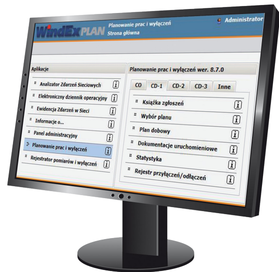
windEX PLAN: Planowanie i koordynacja prac

Moduł służy do uzgodnień z innymi jednostkami organizacyjnymi w dyspozycjach scentralizowanych. Uzgadniane zgłoszenie automatycznie pojawia się w książce zgłoszeń jednostki zatwierdzającej. Planista może wpisać uwagi na temat zgłoszenia, wyłączeń i prac. Zmiany statusów zgłoszeń są odpowiednio sygnalizowane.