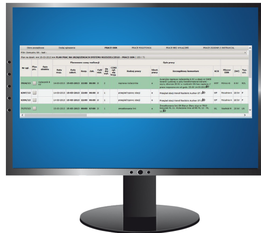
windEX PLAN Widok planu dobowego