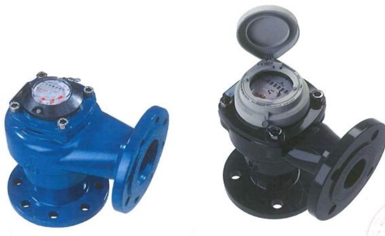
Ilustracja nr 1. Wodomierz Woltmana MK-01 (po lewej) MK-08 (po prawej)

Wodomierze są przystosowane do montażu na rurociągach w rurociągu pionowym z liczydłem skierowanym ku górze. Przypadkowe wystąpienie przepływu wstecznego nie wpływa na charakterystykę metrologiczną przewidzianą dla normalnego przepływu.